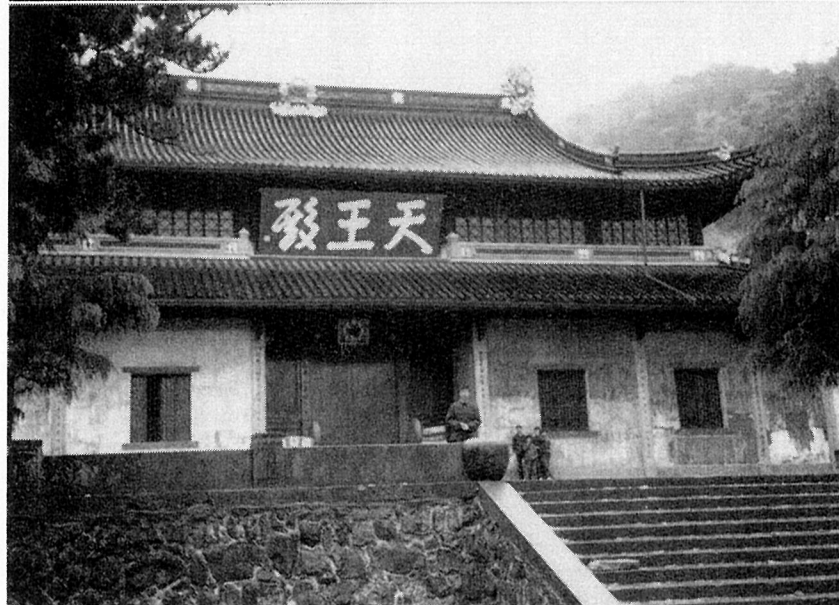
天童寺の法堂(上)・仏殿(中)・天王殿(下)